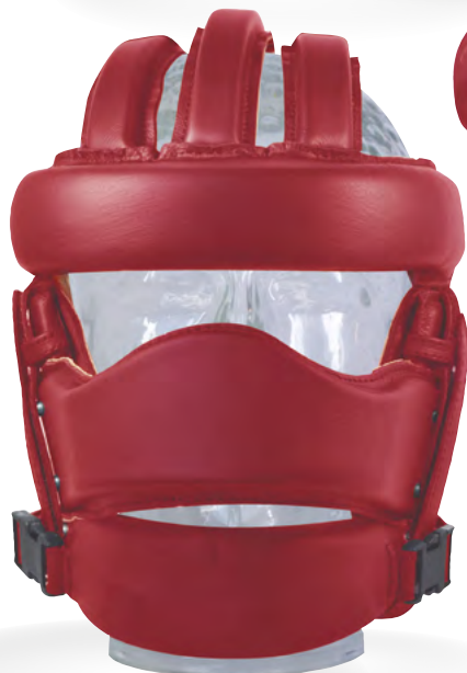
Xtra-Gesichtsschutz mit erhöhtem Nasenschutz in Form eines geschwungenen Nasenbügels (Sonderanfertigung)