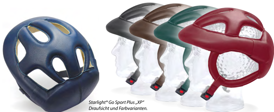
Starlight® Go Sport Plus „XP“ Draufsicht und Farbvarianten.