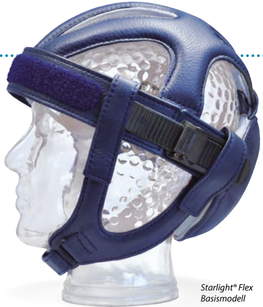
Starlight® Flex Basismodell