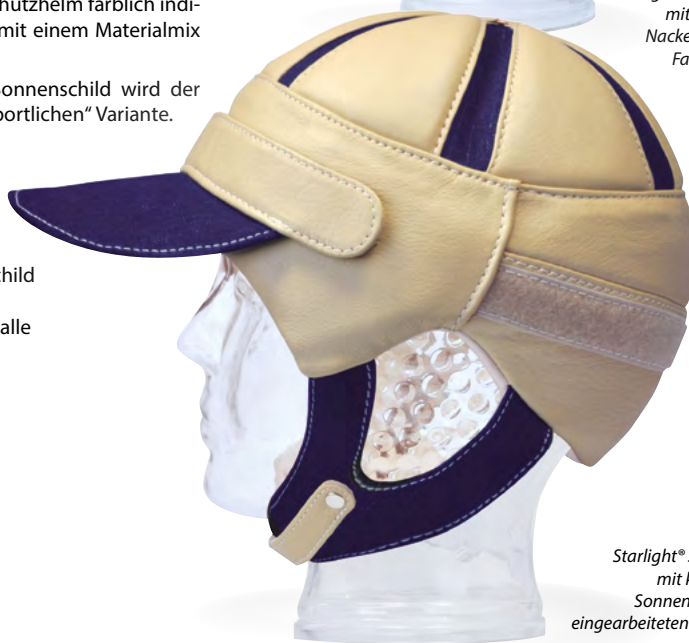
Starlight ® Secure Evo mit klettbarem Sonnenschild und eingearbeiteten Jeansstoff (Option)