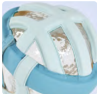
Formschön und sicher