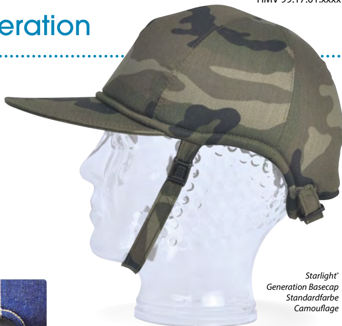
Starlight ® Generation Basecap Standardfarbe Camouflage

Gerne beraten wir Sie hierzu telefonisch unter 06093 944-0 oder durch einen unserer Rehafachberater vor Ort.