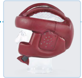
Ohr- und Wangenschutz