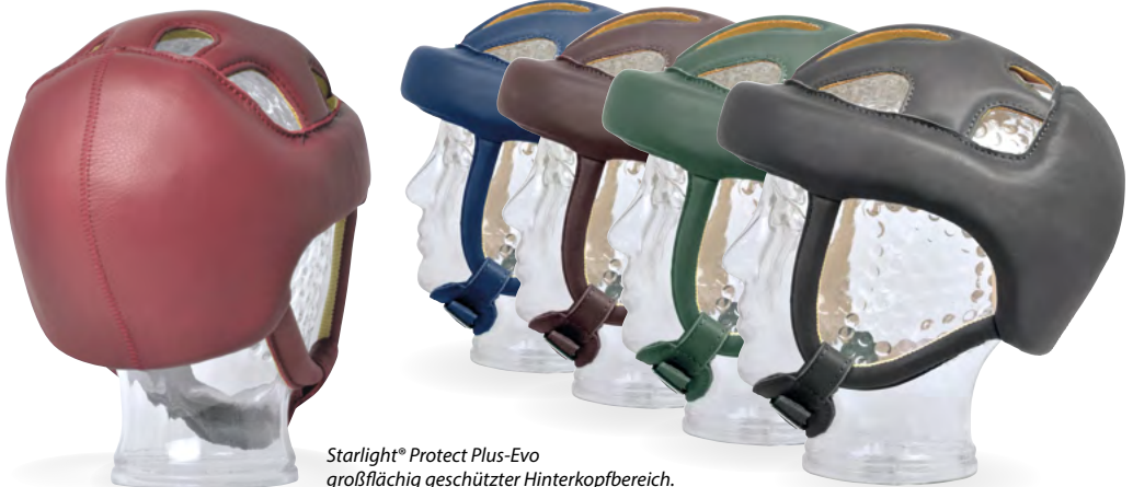
Starlight ® Protect Plus-Evo großflächig geschützter Hinterkopfbereich.