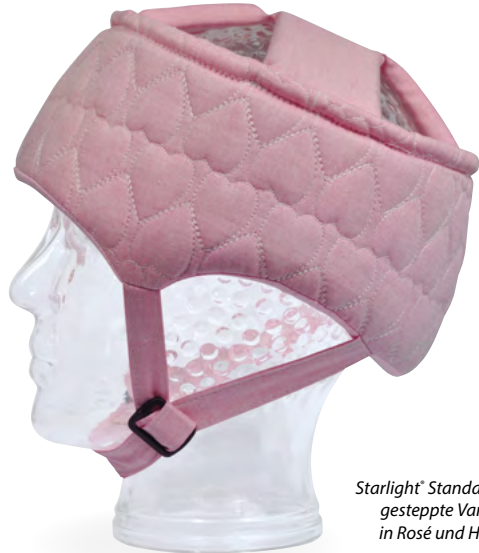
Starlight® Standard Soft gesteppte Varianten in Rosé und Hellblau

In den beiden Sonderfarben Oxford Hellblau und Oxford Rosé ist das Modell Starlight® Standard Soft auch als gesteppte Variante (wie hier abgebildet) erhältlich.