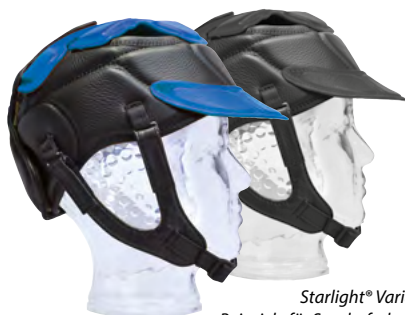
Starlight® Varia Beispiele für Sonderfarben

Starlight® Varia ist durch seine geniale Konstruktion sowohl am Hinter- als auch am Oberkopf individuell verstellbar.