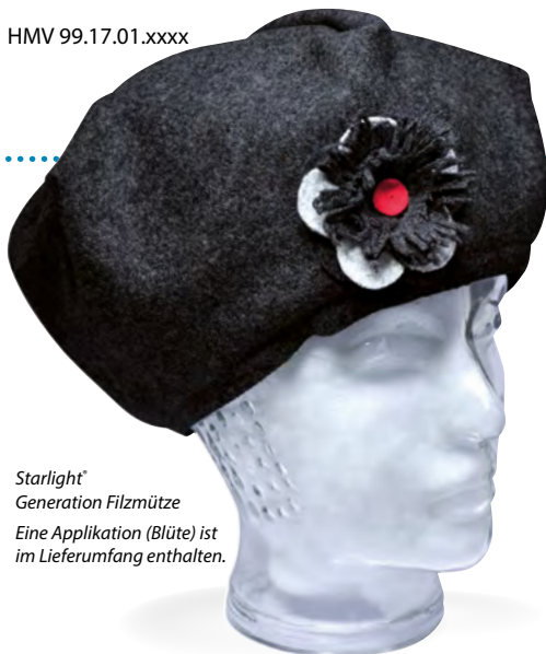
Starlight® Generation Filzmütze Eine Applikation (Blüte) ist im Lieferumfang enthalten.