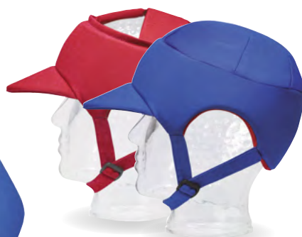
Starlight® Standard Sport sportliche Variante als „Schildkappe“