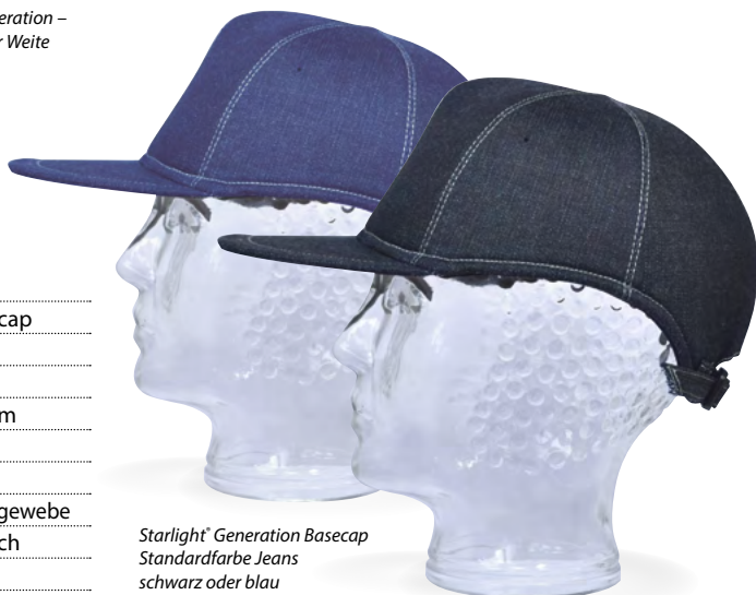
Starlight ® Generation Basecap Standardfarbe Jeans schwarz oder blau