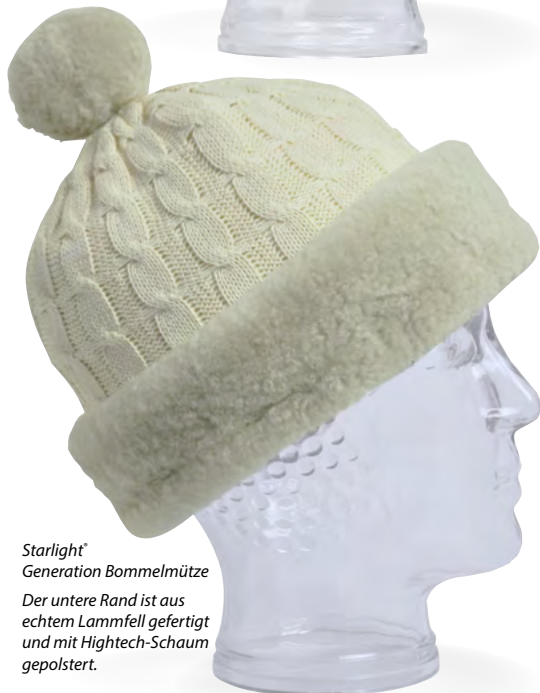
Starlight® Generation Bommelmütze Der untere Rand ist aus echtem Lammfell gefertigt und mit Hightech-Schaum gepolstert.

Die Bommelmütze und die Filzkappe sind wie die anderen Modelle aus unserer Serie Starlight® Generation mit hocheffizientem Hightech-Schaum gepolstert. Die Materialeigenschaften des Schaums gestatten es, die Stärke auf 3 mm zu beschränken. So ist es möglich, einen leichten Kopfschutz anzubieten, der optisch keinerlei Schlüsse darauf zulässt, dass es sich um einen solchen handelt. Die ausgesuchten Materialien und Schnittformen garantieren eine optimale Passform und einen guten Sitz für die „leichte“ Schutzwirkung.