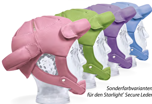
Sonderfarbvarianten für den Starlight ® Secure Leder