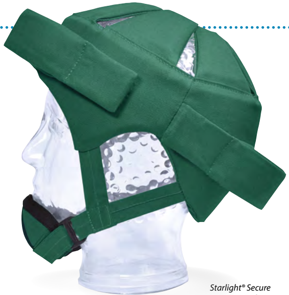
Starlight ® Secure mit Stirn-, Nacken- und Kinnschutz (Zubehör)

Der beste Kopfschutz ist der gern getragene. Farbkombinationen / Sonderstoffe / Sondergrößen für alle Modelle auf Anfrage gegen geringen Preisaufschlag erhältlich.