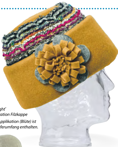
Starlight® Generation Filzkappe Eine Applikation (Blüte) ist im Lieferumfang enthalten.