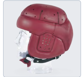
Geschl. Oberseite, Ohrschutz

Spezielle „Handstichnaht“ für den hochwertigen Look