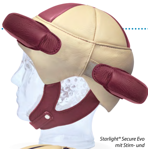
Starlight ® Secure Evo mit Stirn- und Nackenschutz in Farbvariante (Option)