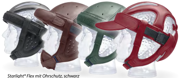
Starlight® Flex mit Ohrschutz, schwarz ...mit geschlossener Oberseite, Stirn- und Kinnschutz, braun ...mit geschlossener Oberseite, grün ...Basismodell mit Sonnenschild, rot