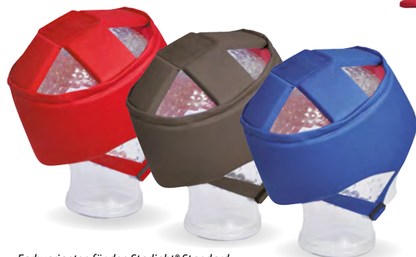
Farbvarianten für den Starlight® Standard