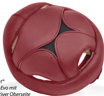
Starlight® Protect-Evo mit alternativer Oberseite