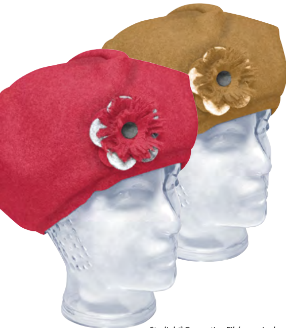
Starlight® Generation Filzkappe in den Standardfarben Rot und Camel

Zum Lieferumfang gehört die Ausstattung mit einem abnehmbaren Kinnriemen, transparent (Filzmütze) oder in Modellfarbe (Basecap). Das Modell Starlight® Generation Filzmütze kann mit einer Applikation (z. B. Blüte) verziert werden.