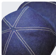
Starlight ® Generation – Naht in Jeansoptik farblich abgesetzt.