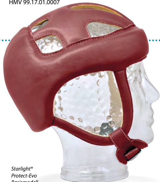
Starlight® Protect-Evo Basismodell