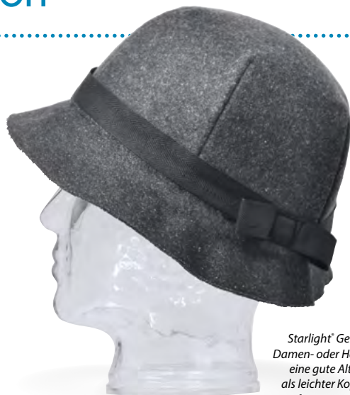
Starlight® Generation Damen- oder Herrenhut eine gute Alternative als leichter Kopfschutz für sturzgefährdete Personen.

Für das Außenmaterial wird bei den Modellen für die modebewusste Dame Filz mit exklusiven Strick- oder Wollgewebe eingesetzt. Für das Innenfutter wird Jersey verwendet. Als Obermaterial bei dem Modell für den Herren wird grober Wollstoff oder Filz verwendet.