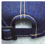
Starlight ® Generation – Einstellung der Weite