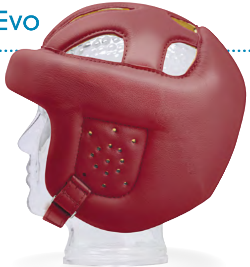
Starlight ® Protect Plus-Evo mit optional erhältlichen Ohrschutz