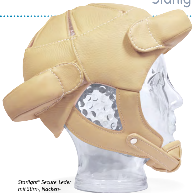
Starlight ® Secure Leder mit Stirn-, Nacken- und Kinnschutz (Zubehör)