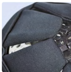
Individuell verstellbare Trapetzpolster