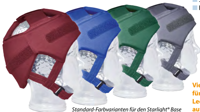
Standard-Farbvarianten für den Starlight® Base

Viele weitere Sonderfarben für unsere Textil oder Ledermodelle finden Sie auf unserer Homepage