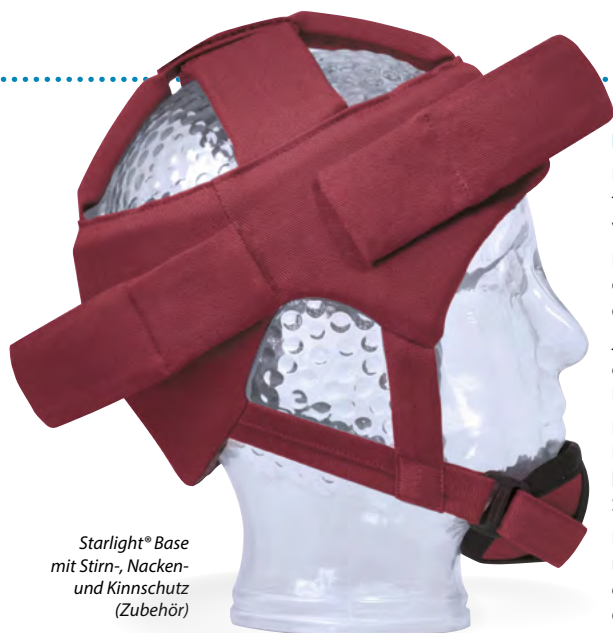
Starlight® Base mit Stirn-, Nacken- und Kinnschutz (Zubehör)